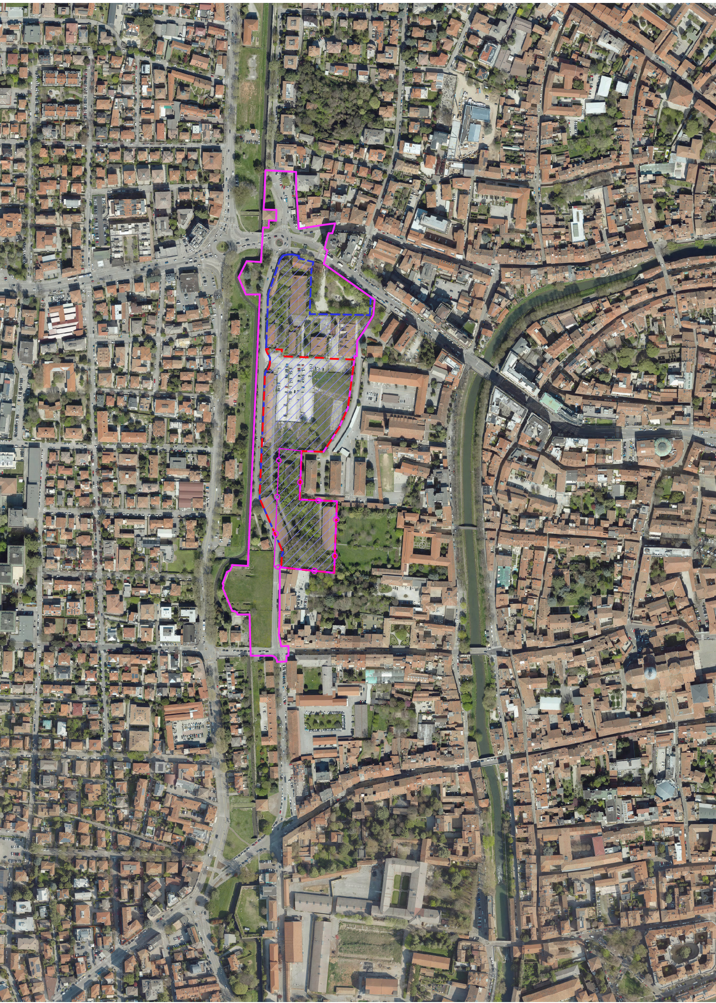
ortofoto scala 1:5000